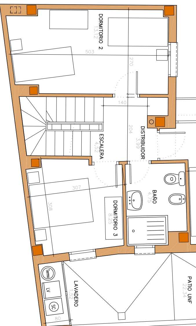
PLANTA 2ª ÁTICO